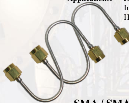
SMA / SMA [Straight/Straight]