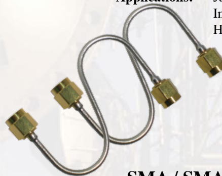
SMA / SMA [Straight/Straight]