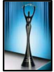
Elektra Award 2005