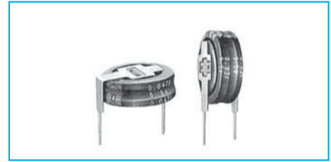
Marking color : White print on a black sleeve