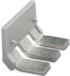
Insertion bridge, Number of positions: 3, Color: gray

Please be informed that the data shown in this PDF Document is generated from our Online Catalog. Please find the complete data in the user's documentation. Our General Terms of Use for Downloads are valid ( http://phoenixcontact.com/download )