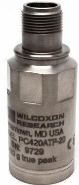
Table 1: PC420ATP-yy model selection guide

Wilcoxon's PC420ATP series sensors provide 24/7 output of true peak acceleration, allowing for continuous trending of overall machine vibration in process control systems. True peak output is particularly useful in detecting loose parts on reciprocating machinery. The trend data alerts users to changing machine conditions and helps guide maintenance in prioritizing the need for service.