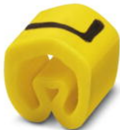
Conductor marking collar, labeled with the capital letter: Letters, yellow, width: 3.2 mm

Please be informed that the data shown in this PDF Document is generated from our Online Catalog. Please find the complete data in the user's documentation. Our General Terms of Use for Downloads are valid ( http://phoenixcontact.com/download )