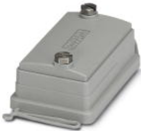
HEAVYCON ADVANCE, IP66, B6 protective cover for panel mounting side, with screw locking, with retaining cord, diameter of retaining cord eyelet: 3 mm

Please be informed that the data shown in this PDF Document is generated from our Online Catalog. Please find the complete data in the user's documentation. Our General Terms of Use for Downloads are valid ( http://phoenixcontact.com/download )