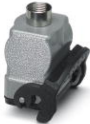
HEAVYCON B6 coupling housing, with single locking latch, height: 77.5 mm, with 1 x Pg29 gland, straight cable outlet

Please be informed that the data shown in this PDF Document is generated from our Online Catalog. Please find the complete data in the user's documentation. Our General Terms of Use for Downloads are valid ( http://download.phoenixcontact.com )