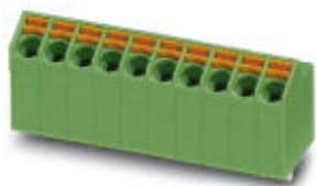
The figure shows the 10-position version

PCB terminal block, nominal current: 9 A, nom. voltage: 200 V, pitch: 3.5 mm, number of positions: 5, connection method: Push-in spring connection, mounting: Wave soldering, conductor/PCB connection direction: 65 °, color: green