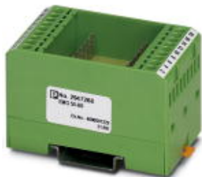
Custom circuit module, consisting of housing, MKDS 3 connection terminal blocks and PCB

Please be informed that the data shown in this PDF Document is generated from our Online Catalog. Please find the complete data in the user's documentation. Our General Terms of Use for Downloads are valid ( http://phoenixcontact.com/download )