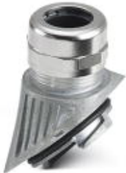
EVO metal cable gland with bayonet locking, B series, size M32, cable diameter: 14 - 21 mm

Please be informed that the data shown in this PDF Document is generated from our Online Catalog. Please find the complete data in the user's documentation. Our General Terms of Use for Downloads are valid ( http://phoenixcontact.com/download )