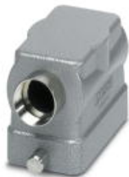
Sleeve housing, for single locking latch, height: 56 mm, with gland, 1 x M20, lateral cable outlet

Please be informed that the data shown in this PDF Document is generated from our Online Catalog. Please find the complete data in the user's documentation. Our General Terms of Use for Downloads are valid ( http://phoenixcontact.com/download )