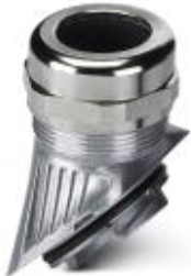
EVO metal cable gland with bayonet locking; size M40, for 8 conductors with 6.5 mm cable diameter

Please be informed that the data shown in this PDF Document is generated from our Online Catalog. Please find the complete data in the user's documentation. Our General Terms of Use for Downloads are valid ( http://phoenixcontact.com/download )