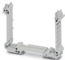
Component housing, length: 99 mm, Lower part, color: light gray, width: 22.5 mm

Please be informed that the data shown in this PDF Document is generated from our Online Catalog. Please find the complete data in the user's documentation. Our General Terms of Use for Downloads are valid ( http://phoenixcontact.com/download )