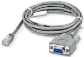
Cable, serial, 9-pos. D-SUB to RJ45

Please be informed that the data shown in this PDF Document is generated from our Online Catalog. Please find the complete data in the user's documentation. Our General Terms of Use for Downloads are valid ( http://phoenixcontact.com/download )