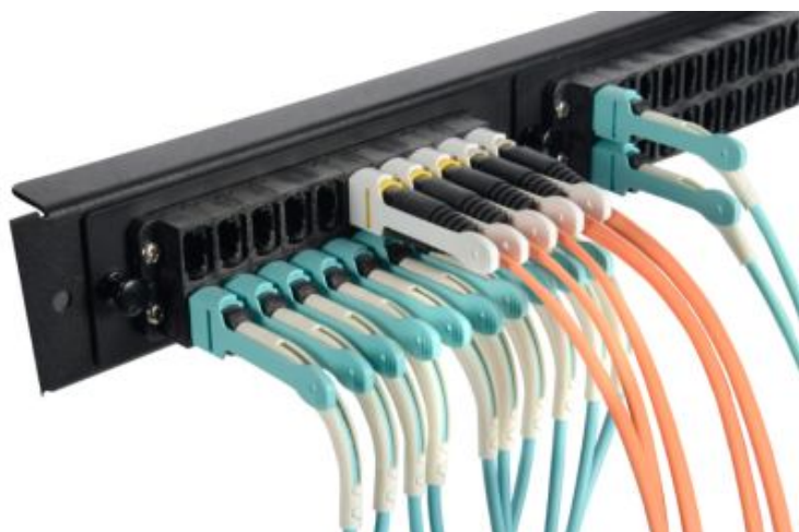
MPO Stackable Adapters w/19" Faceplate & Pull Tabs