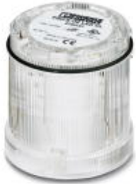
LED permanent light element, 24 V AC/DC, clear

Please be informed that the data shown in this PDF Document is generated from our Online Catalog. Please find the complete data in the user's documentation. Our General Terms of Use for Downloads are valid ( http://phoenixcontact.com/download )