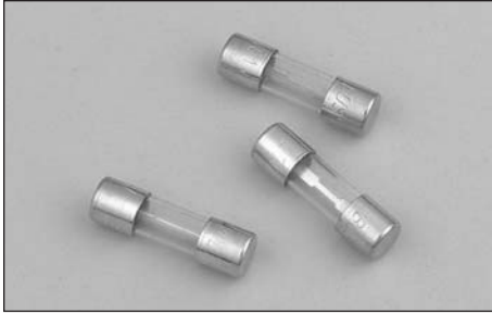
Dimensions - in