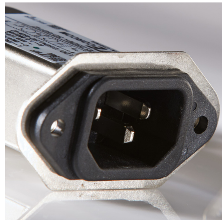
EJT Flanged EMI Filter