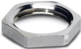
Flat nut with Pg9 thread

Please be informed that the data shown in this PDF Document is generated from our Online Catalog. Please find the complete data in the user's documentation. Our General Terms of Use for Downloads are valid ( http://download.phoenixcontact.com )