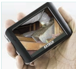
Detachable wireless 3.5" color TFT LCD display can be viewed from a remote location up to 32ft (10m) from the measurement point.

Complete with 4 AA batteries, rechargeable display battery, microSD memory card with SD adaptor, USB cable, extension tools (mirror, hook, magnet) video interconnect cable, AC adaptor (100-240V, 50/60Hz), magnetic base stand, and hard case