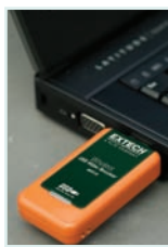
BRD10 - Optional Wireless USB Video Receiver allows user to stream live video to a PC and also can be remotely viewed via VOIP connection