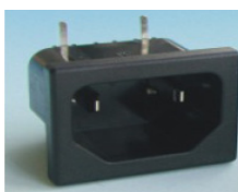
"Q" = IEC320 C18 Ungrounded