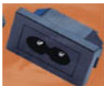
"N" = IEC320 C8 Ungrounded