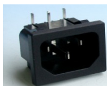
"F" = IEC320 C14 Grounded