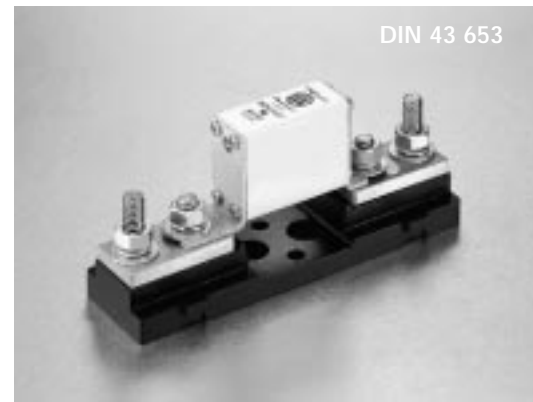
DIN 43 653