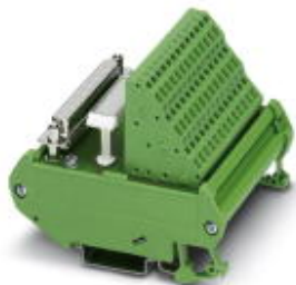
VARIOFACE module, with spring-cage connection and D-Subminiature socket strip, for mounting on NS 35/7.5 or NS 32, 37-pos.

Please be informed that the data shown in this PDF Document is generated from our Online Catalog. Please find the complete data in the user's documentation. Our General Terms of Use for Downloads are valid ( http://phoenixcontact.com/download )