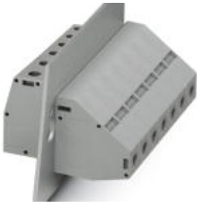
The illustration shows version HDFKV 50 in gray

Please be informed that the data shown in this PDF Document is generated from our Online Catalog. Please find the complete data in the user's documentation. Our General Terms of Use for Downloads are valid ( http://download.phoenixcontact.com )