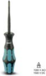
Screwdriver, crosshead PZ (lasered), insulated, size: PZ 1 x 80, 2-component handle, with non-slip grip

Please be informed that the data shown in this PDF Document is generated from our Online Catalog. Please find the complete data in the user's documentation. Our General Terms of Use for Downloads are valid ( http://download.phoenixcontact.com )