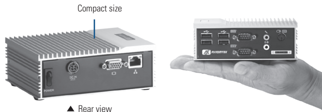
▲ Rear view