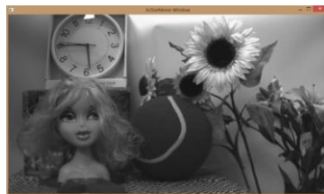
Camera Tool view mode