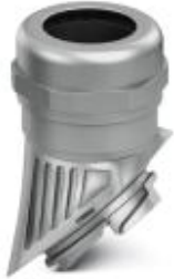
EVO EMC cable gland with bayonet locking, B series, size M40, cable diameter: 19 - 27 mm

Please be informed that the data shown in this PDF Document is generated from our Online Catalog. Please find the complete data in the user's documentation. Our General Terms of Use for Downloads are valid ( http://phoenixcontact.com/download )