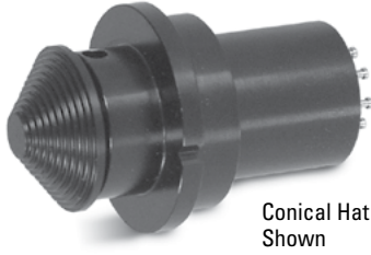
Conical Hat Shown