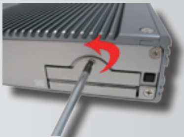
Unscrew and pull down the door