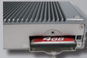
Insert CF card