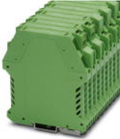
Filler plugs, for unoccupied terminal points

Please be informed that the data shown in this PDF Document is generated from our Online Catalog. Please find the complete data in the user's documentation. Our General Terms of Use for Downloads are valid ( http://phoenixcontact.com/download )