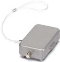
HEAVYCON protective cover, type B10, for supporting base element with single locking latch, with retaining cord, IP65, ALU

Please be informed that the data shown in this PDF Document is generated from our Online Catalog. Please find the complete data in the user's documentation. Our General Terms of Use for Downloads are valid ( http://download.phoenixcontact.com )