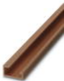
G-profile DIN rail, deep-drawn, material: Copper, unperforated, height 15 mm, width 32 mm, length 2 m

DIN rail - NS 32 CU/120QMM UNPERF 2000MM - 1201280