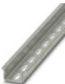
DIN rail, material: steel galvanized and passivated with a thick layer, perforated, height 15 mm, width 35 mm, length: 2000 m

DIN rail perforated - NS 35/15 PERF 2000MM - 1201730