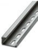
G-profile DIN rail, material: Steel, perforated, height 15 mm, width 32 mm, length 2 m

DIN rail - NS 35/15 CU UNPERF 2000MM - 1201895