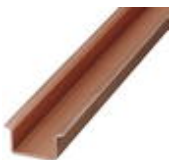
DIN rail, material: Copper, unperforated, 1.5 mm thick, height 15 mm, width 35 mm, length: 2 m

DIN rail - NS 35/15 CU UNPERF 2000MM - 1201895