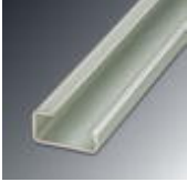
G rail 32 mm (NS 32)

DIN rail - NS 32 AL UNPERF 2000MM - 1201028