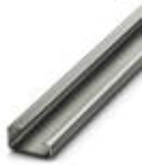
G-profile DIN rail, material: Steel, unperforated, height 15 mm, width 32 mm, length 2 m

DIN rail - NS 32 UNPERF 2000MM - 1201015