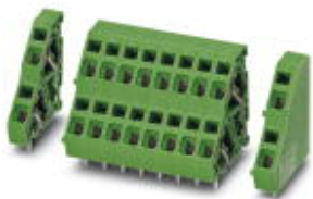
The figure shows a 10-pos. version with 20 contacts

PCB terminal block, nominal current: 17.5 A, nom. voltage: 400 V, pitch: 5.08 mm, number of positions: 1, connection method: Spring-cage connection, mounting: Wave soldering, conductor/PCB connection direction: 45°, color: gray