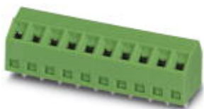
The figure shows a 10-position version of the product

PCB terminal block, nominal current: 10 A, nom. voltage: 200 V, pitch: 3.5 mm, number of positions: 5, connection method: Screw connection with tension sleeve, mounting: Wave soldering, conductor/PCB connection direction: 35 °, color: green