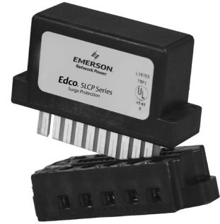
EDCO PCB1B-WKEY BASE SOLD SEPARATELY