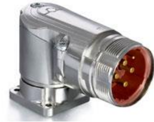
Contact Arrangement mating view

C ED E 271 NN 00 00 0020 000 C G E 271 N 00 00 0020 000