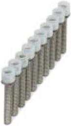
Jumper, Number of positions: 100, Color: silver

Please be informed that the data shown in this PDF Document is generated from our Online Catalog. Please find the complete data in the user's documentation. Our General Terms of Use for Downloads are valid ( http://phoenixcontact.com/download )