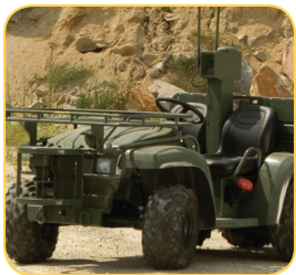
Navigation and Control