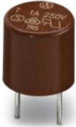
Replacement fuse, for INTERBUS-ST modules

Please be informed that the data shown in this PDF Document is generated from our Online Catalog. Please find the complete data in the user's documentation. Our General Terms of Use for Downloads are valid ( http://phoenixcontact.com/download )