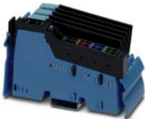
Inline power terminal for power supply to intrinsically safe I/O terminals

Please be informed that the data shown in this PDF Document is generated from our Online Catalog. Please find the complete data in the user's documentation. Our General Terms of Use for Downloads are valid ( http://phoenixcontact.com/download )