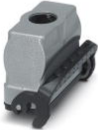
HEAVYCON B16 coupling housing, with single locking latch, height: 82 mm, with 1 x M32 thread, straight cable outlet

Please be informed that the data shown in this PDF Document is generated from our Online Catalog. Please find the complete data in the user's documentation. Our General Terms of Use for Downloads are valid ( http://phoenixcontact.com/download )