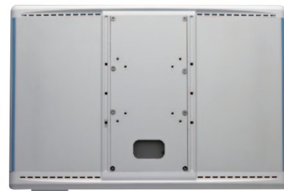
Cable-free Design Enhances Infection Control