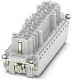
HEAVYCON socket insert, for 830 V (III/3), with 10 N/O contacts and 2 switch contacts, crimp connection

Please be informed that the data shown in this PDF Document is generated from our Online Catalog. Please find the complete data in the user's documentation. Our General Terms of Use for Downloads are valid ( http://phoenixcontact.com/download )