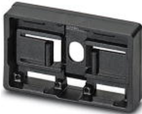
Marker carriers, black, unlabeled, Mounting type: Screws, rivets, Lettering field: 49 x 15 mm

Please be informed that the data shown in this PDF Document is generated from our Online Catalog. Please find the complete data in the user's documentation. Our General Terms of Use for Downloads are valid ( http://phoenixcontact.com/download )