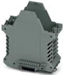
Component housing, color: gray

Please be informed that the data shown in this PDF Document is generated from our Online Catalog. Please find the complete data in the user's documentation. Our General Terms of Use for Downloads are valid ( http://phoenixcontact.com/download )