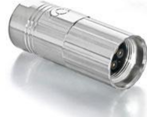
Contact Arrangement mating view

B ST A 896 NN 00 85 202A 000 B S A 896 N 00 85 202A 000